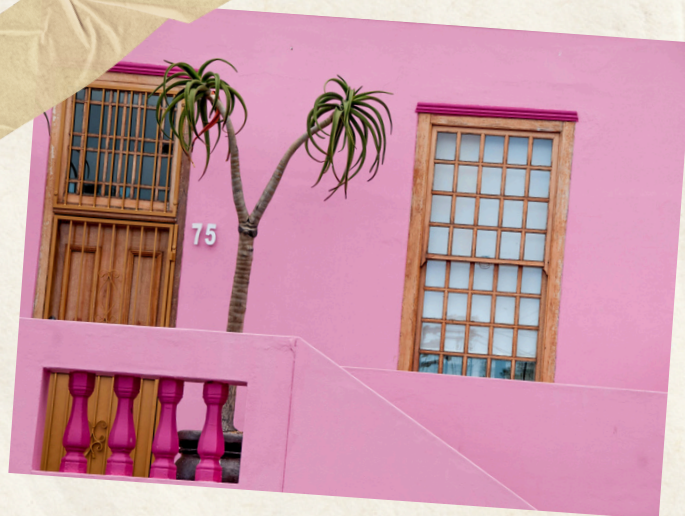
Jour 2 : Mindelo