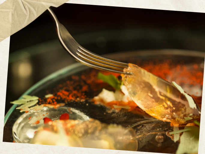
Jour 4 : Gastronomie