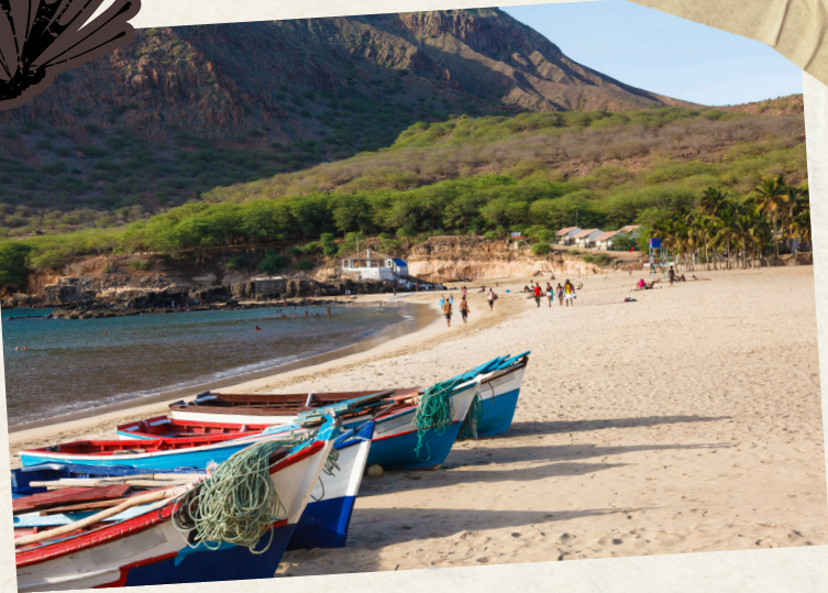
Jour 6 : Santo Antão