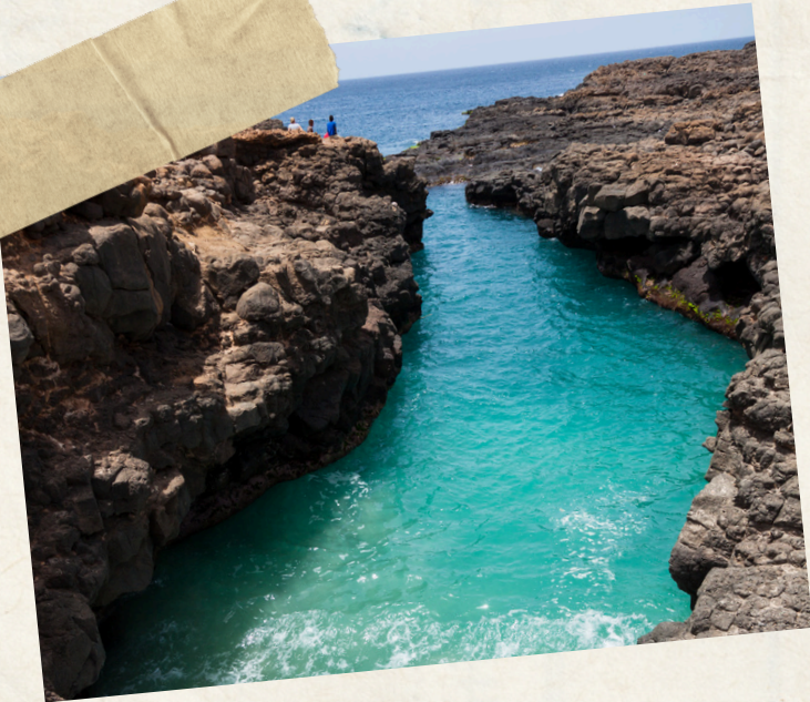
Jour 8 : Day off