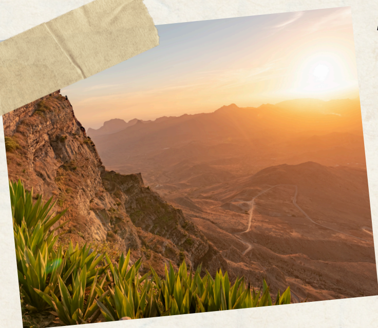
Jour 3 : São Vicente