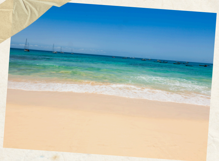
Jour 9 : Retour São Vicente