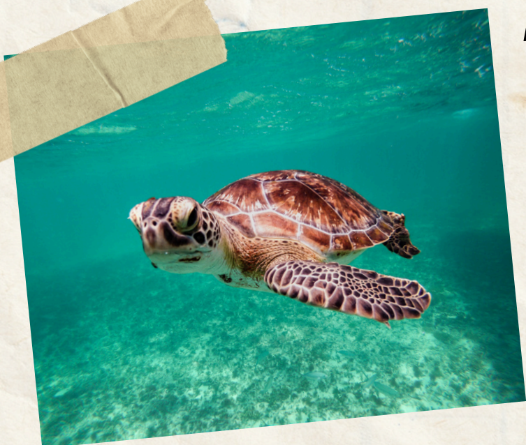
Jour 5 : Détente et snorkeling