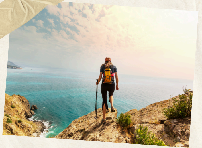
Jour 7 : Randonnée