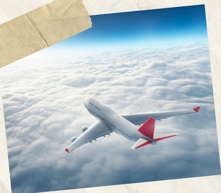
Jour 10 : Départ