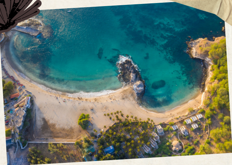
Jour 1 : Accueil